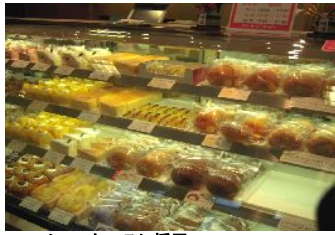
ショーケースに採用 用途